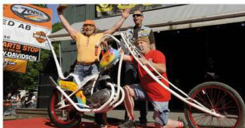
NORRTÄLJE (S) / CUSTOM BIKE SHOW N.50