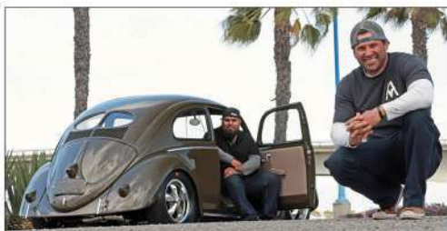
1952 VW BEETLE / FAST BUG