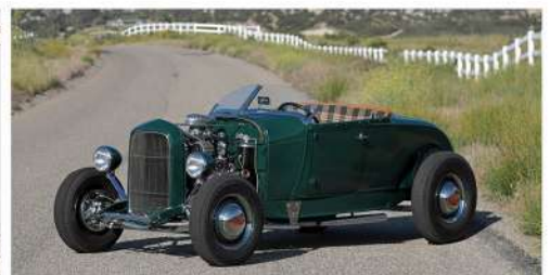
1929 FORD ROADSTER / HOT ROD